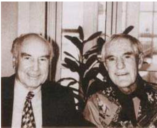
Albert Hofmann und Timothy Leary in Hamburg, 1993

"Ici Rittmatte, 629 m." steht auf dem Schild neben einem Grenzstein aus der napoleonischen Zeit. Die Grenze zu Frankreich verläuft direkt über diese Bergwiese in den Ausläufern des Schweizer Juras. Hier steht das "Bänkli" mit weiter Aussicht über das Baseler Land und den Konturen der Vogesen und Schwarzwalds am Horizont, der Lieblingsplatz eines Mannes, der - sowohl was die Ausblicke, als auch was die Grenzen des Bewusstseins betrifft - Geschichte gemacht hat: Dr. Dr. hc. mult. Albert Hofmann, der Entdecker des LSD. Heute wird Albert Hofmann 100 Jahre alt. Doch auch wenn er seit einer Hüftoperation vor drei Jahren mit Stöcken gehen muss, lässt er es sich an diesem strahlenden Augusttag nicht nehmen, mit uns die 500 Meter von seinem Haus hinauf zum "Bänkli" zu spazieren.