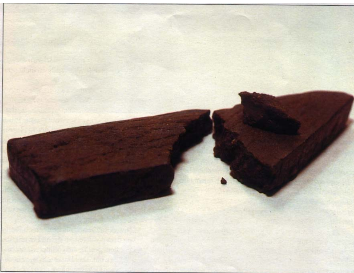
Nepal: Road To Bhutan

bung vom Typ „Pollen“. Auch wenn in Zukunft nepalesischer „Pollen“ auf den europäischen Markt gelangen sollte, bleibt vielleicht noch ein Funke Hoffnung, daß das Geheimnis der sorgfältigen Herstellung erstklassigen handgeriebenen „Nepalesen“ in abgelegenen Regionen noch eine Zeitlang bewahrt wird.