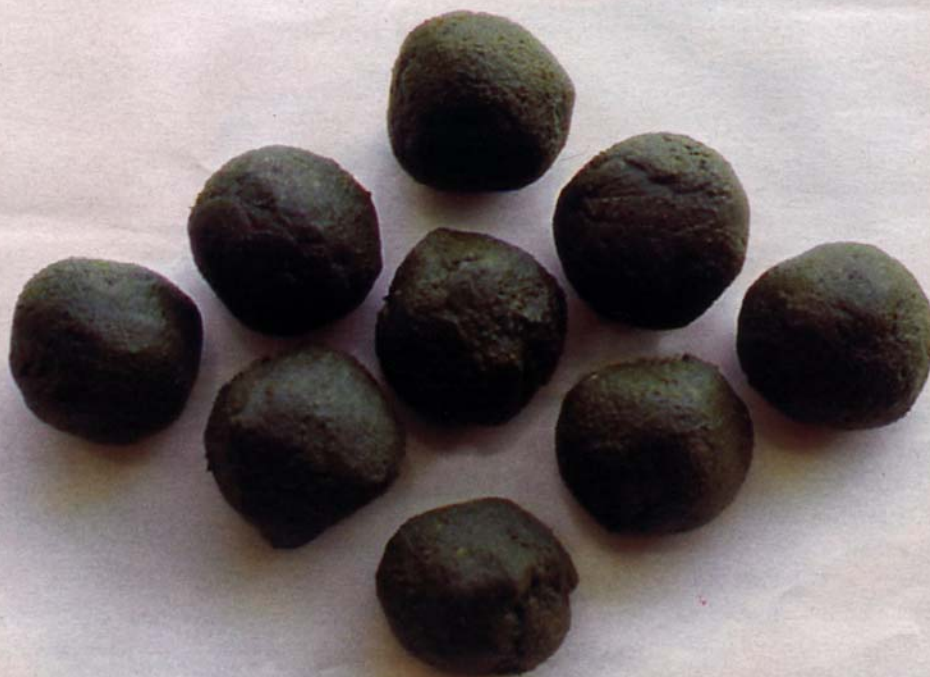
Bhang: Bei dieser indischen Spezialität handelt es sich nicht um Haschisch sondern um Blätter, die mit Butterschmalz und anderen Zutaten zu Kugel geformt werden, die dann gegessen werden.

„Afghanen“, ruhig, tief, euphorisch, in der Regel nicht ganz so ermüdend, aber irgendwie charakterlos. In Ausnahmefällen handelt es sich um beglückende, wirklich feine, starke Qualitäten. Diese kommen vereinzelt aus dem Pathanengebiet (Khaiberpaß) in der Grenzregion zu Afghanistan oder besser noch aus den Hochgebirgstälern (des Hindu Kush), von denen „Chitral“ („Chitral Hash“) und „Swat“ die bekanntesten sein dürften.