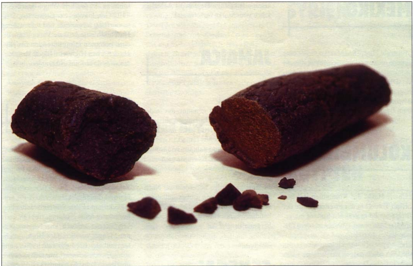
Nepal: Baba Ohmorgi