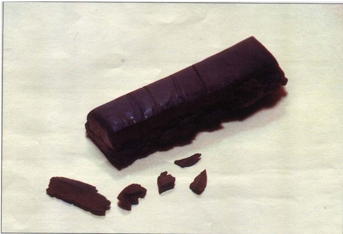
Nepalese: Diese Variante stammt aus Kathmandu

Unter dieser Bezeichnung werden mit Blattgoldaufdruck veredelte kompakte Blöcke und Platten weichen, gräulich-schwarzen, gut knetbaren Haschischs mit blumig-parfümiertem Geruch von ein-