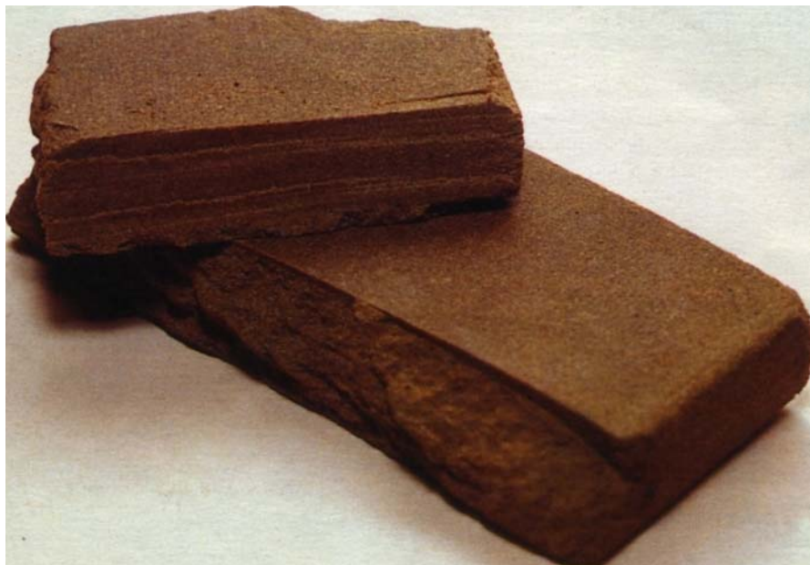
Marakesh Gold. Eine der vielen marokkanischen Spezialitäten

was auf dem Schwarzmarkt unter einem wohlklingenden Namen angeboten wird auch dem, als was es angepriesen wird.