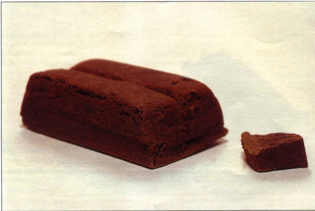
Typische Färbung: Roter Libanese