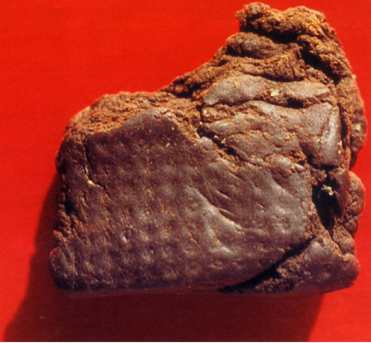
Charas aus Nepal